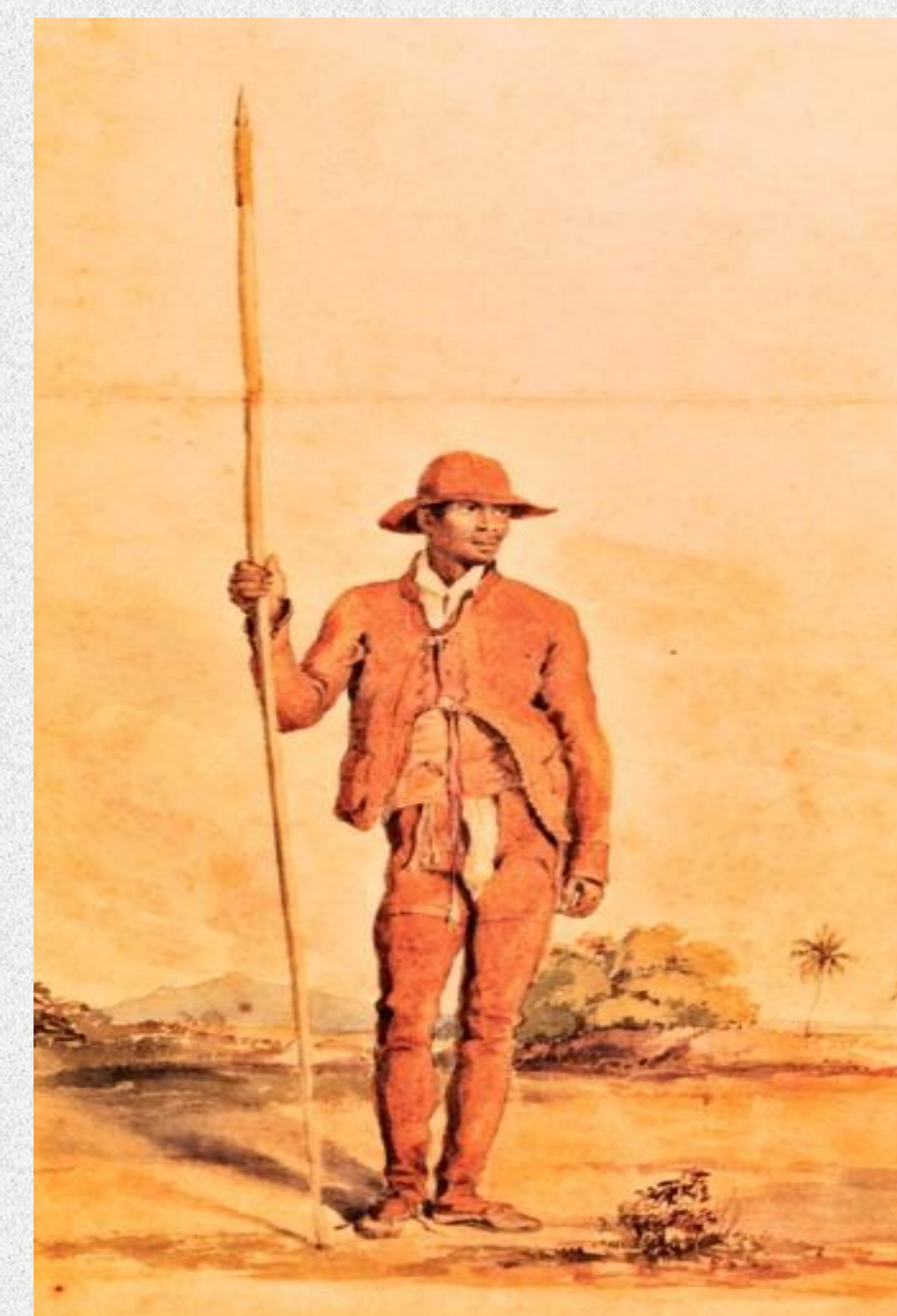
Sertanejo ou vaqueiro do sertão de Pernambuco, ilustração de Charles Landseer.

O que resta aos historiadores é a leitura dos relatórios dessa elite dominante. Terminados os conflitos, o resultado foi a vitória dos amotinados: conseguiram suspender o decreto sobre o registro civil obrigatório, que só seria instituído com a implantação do regime republicano, e o primeiro recenseamento de âmbito nacional só foi feito em 1872.