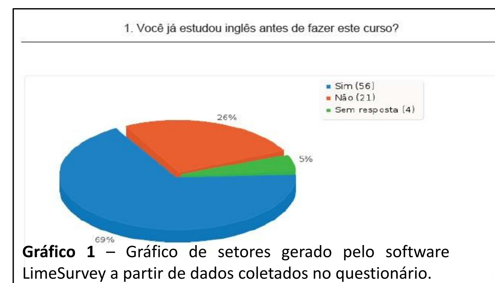
Gráfico 1 – Gráfico de setores gerado pelo software LimeSurvey a partir de dados coletados no questionário.

O instrumento, por ser bastante amigável, permitiu que o técnico não encontrasse dificuldades para desenvolver o questionário envolvendo todas as formas de questões solicitadas.