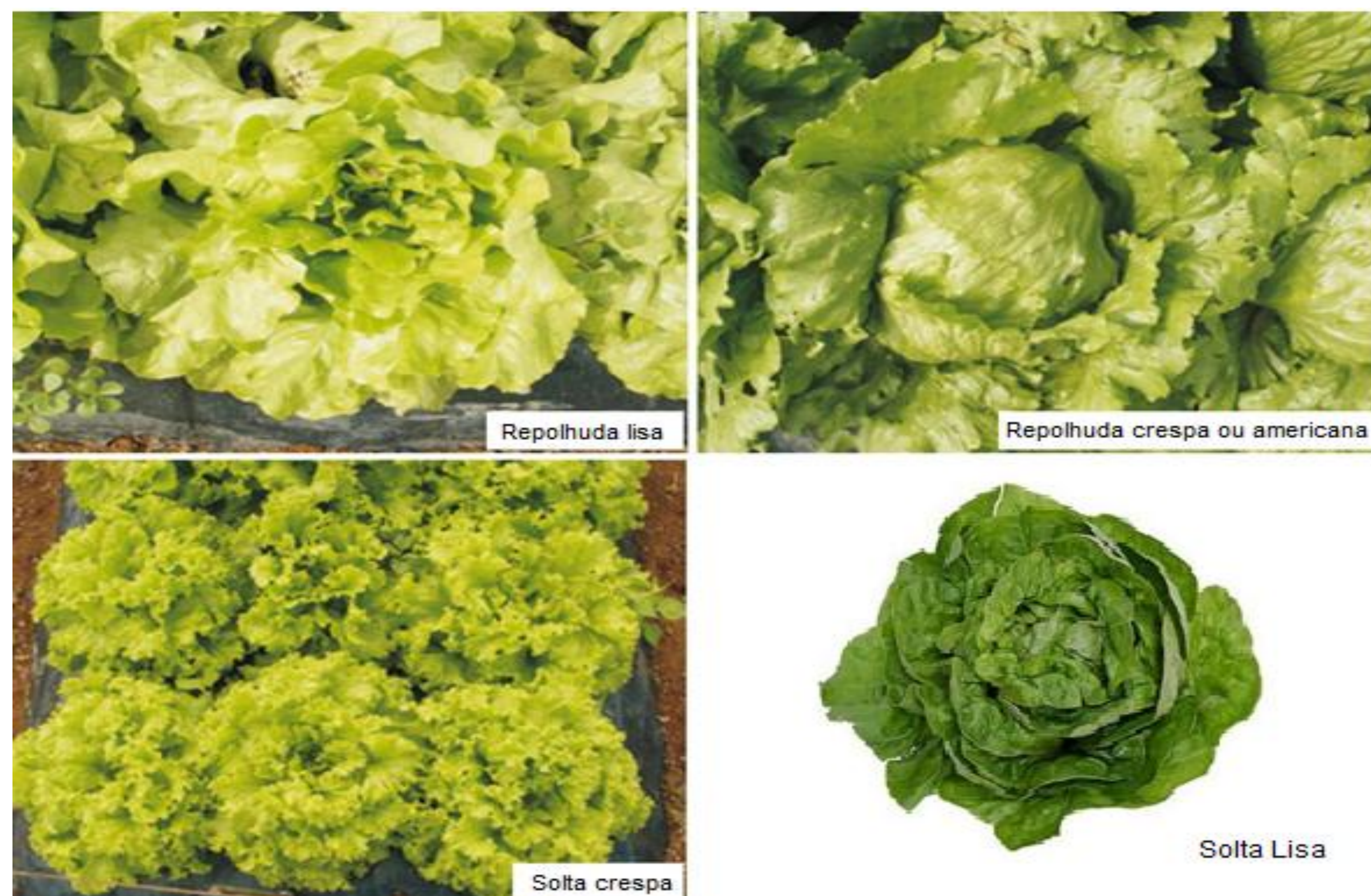
Figura 1. Tipos morfológicos principais da alface, Repolhuda Lisa, Repolhuda Crespa ou Americana, Solta Crespa, Solta Lisa. Fonte. Embrapa (2009).

O presente trabalho visou estudar a influência de processos de colheita diferenciados em quatro tipos de alface (Repolhuda Americana ‘Graciosa’, Solta Crespa ‘Vanda’, Solta Lisa ‘Marcela’ e Solta Crespa ‘Lavínia’) com objetivo de manuseio mínimo e manutenção de sua qualidade, dentro dos padrões seguros e legais de consumo. Este faz parte de um projeto mais amplo (FAPESP 2011/50036-6) intitulado Qualidade de Alface em Sistema Integrado de Colheita e Pós-Colheita.