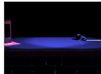
Simulação da iluminação.