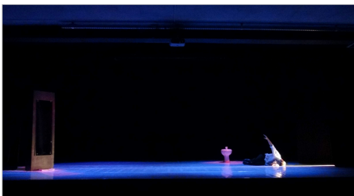
Apresentação do Espetáculo "Ômi".