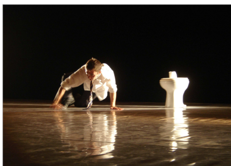
Apresentação do Espetáculo "Ômi".