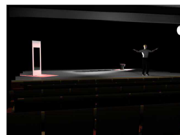
Simulação da iluminação.

Simulações: Valmir Perez