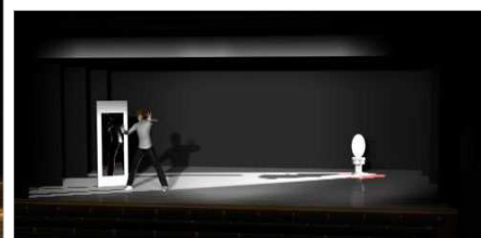
Simulação da iluminação.