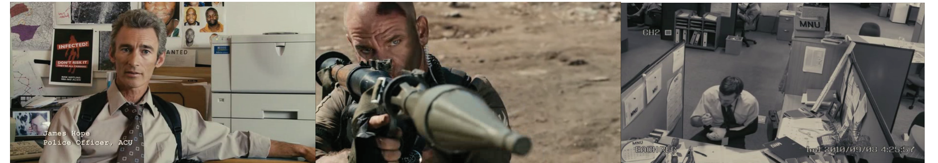
FIGURAS 1, 2 E 3 – DOCUMENTÁRIO CLÁSSICO, CÂMERA ONISCIENTE E CÂMERA DE VIGILÂNCIA RESPECTIVAMENTE

Formalmente, o filme opera em dois regimes: o documentário e a ficção. Oscilando o registro ocasionalmente, a ficção é inserida numa “moldura de documentário”. O filme se inicia e termina através da retórica do documentário e, em certas partes, faz uso de uma espécie de “documentarismo diagético”, utilizando diversas tomadas de câmera de vigilância espalhadas por Joanesburgo, como pode ser observado na figura 3.