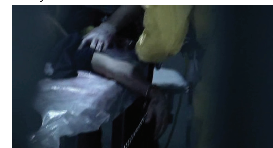
FIGURAS 5 - DESENQUADRAMENTO

Em REC, toma-se a textura do vídeo como sintoma da realidade. No entanto, diferente de outros mockumentaries de terror, que a usam como um relato amador para aproximação da realidade, aqui, a base usada é o telejornalismo e, portanto, não amadora. Assim como os longas que utilizam relatos não profissionais, REC usa de artifícios que não seriam condizentes com sua base estrutural, como câmera tremida, desenquadramentos e variações de foco e de zoom, como se vê na imagem 5. A televisão busca uma imagem “auto-gerada”, limpa, já que é esta a imagem base para a informação televisiva.