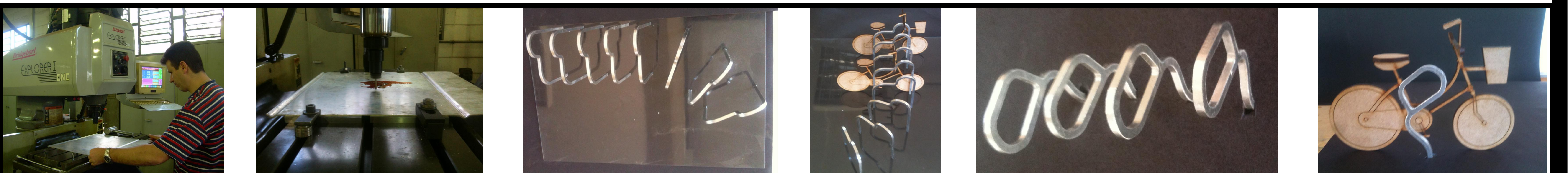
Figuras 7 e 8: Modelos confeccionados em alumínio numa BridgePort Explorer I CNC. Figuras 9 a 12: Estudo de variáveis de implantação dos objetos com tipologias padrão de bicicletas prototipadas em mdf.

As simulações digitais 3D serviram para a realização de ajustes nos modelos desenvolvidos. Posteriormente, serviram para se obter noções visuais de possibilidades compositivas para bicicletários compostos pelas peças desenvolvidas. Os processos de fabricação definidos para a produção dos objetos impossibilitaram a confecção dos mesmos em escala 1:1. Desta maneira, fez-se protótipos em escala 1:10 numa BridgePort Explorer I CNC.