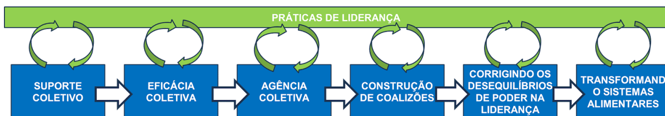
Figura 1 -Nodos da Teoria da Mudança

A revisão de escopo tem como objetivo definir cada um desses nodos da Teoria da Mudança proposta para as atividades do NGLC incluindo saberes de diferentes áreas do conhecimento.