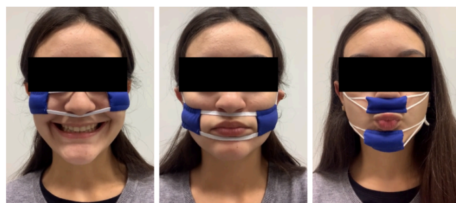
Exercícios para fortalecimento do músculo zigomático, bucinador e orbicular da boca, respectivamente.

Considerando que a correta execução e repetição dos exercícios isométricos e miofuncionais é indispensável para obter-se resultados coerentes, desenvolveu-se um vídeo demonstrativo para ser enviado aos participantes do grupo A. Nele, deu-se enfoque na posição dos aparatos sob a face e na maneira adequada de encaixá-los sob cada músculo; na postura do corpo e do rosto; e, principalmente, na intensidade e velocidade dos movimentos a serem realizados. A Figura 3 representa partes do tutorial, o qual foi elogiado pelos participantes, que relataram ter entendido os procedimentos muito melhor após assistirem ao vídeo e enfatizaram