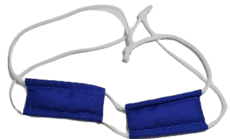
Figura 1. Aparato com peso utilizado pelo grupo A.

Foi solicitado que os procedimentos fossem realizados durante 60 dias, diariamente. No primeiro (T0) e no último dia (T60) foram feitas as análises de cutometria. No grupo teste A, 10 participantes realizaram 5 tipos de exercícios faciais com o uso do aparato com peso (Figura 1), em 5 séries e 3 repetições de cada, de acordo com a Figura 2. Concomitantemente, fizeram uso de formulação cosmética com ácido hialurônico e vitamina C, aplicando-a no rosto uma vez ao dia. No grupo teste B, 10 participantes fizeram uso da mesma formulação cosmética, com os mesmos ativos, mas não realizaram os exercícios faciais.