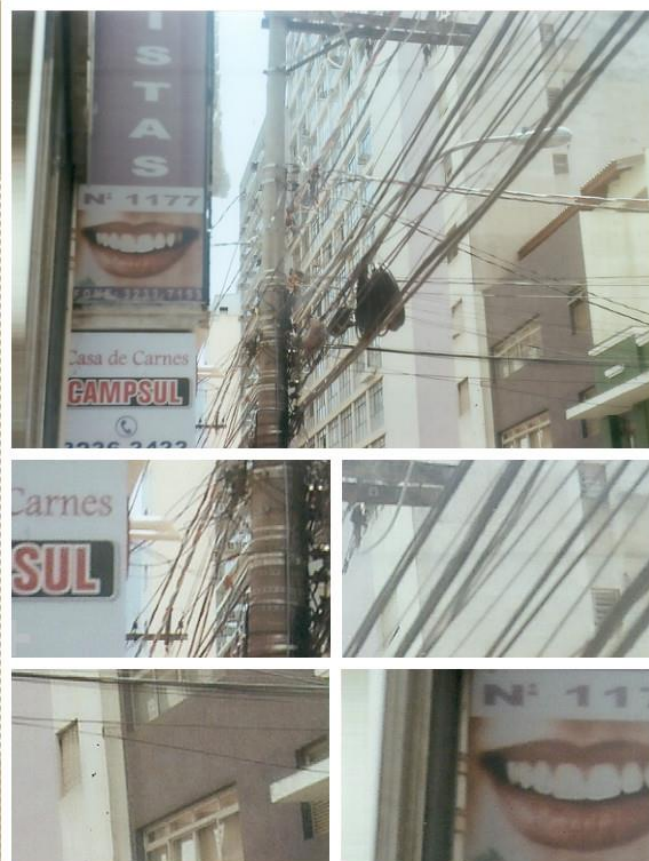
Figura 02. COLLANGE, M. Composição autoral. CAMPINAS, 2015.