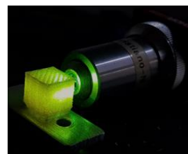
Figura 3. Momento de aplicação do laser verde.