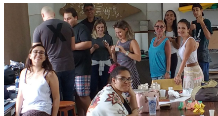
Figura 2. LMM - Bolsistas PIBIC-EM em atividade prática juntamente com alunos das disciplinas de verão 2018.

Num ambiente de aprendizagem colaborativo, os bolsistas também foram expostos a um contexto diferente. Acompanharam integralmente atividades práticas dadas em conjunto com duas disciplinas no verão de 2018, onde tiveram contato com alunos de graduação e de pós-graduação, como ilustra a imagem da Figura 2.