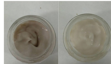
Figura 2. Formulação com extrato livre e com microcápsulas do extrato

As emulsões foram colocadas em 5 ambientes diferente. No dia 0 a emulsão com o extrato livre apresentou FPS in vitro igual a 3,75 e uma porcentagem de inibição de 79%, enquanto a emulsão com a microcápsula apresentou um FPS in vitro igual a 1,36 e um porcentagem de inibição de 35%. Estas características serão avaliadas durante os dias 7,15,30,45,60 e 90.