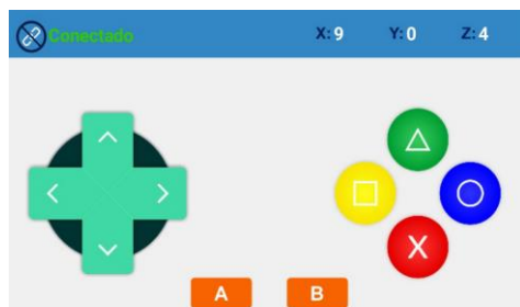
Figura 1. Interface de controle do aplicativo.

Para realizar a comunicação com módulo robótico, foi desenvolvido um aplicativo que pode ser instalado no smartphone e possui diferentes interfaces de controle. Uma delas, mostrada na Figura 1, é semelhante a um controle de vídeo game e, além dos botões, disponibiliza também os dados do acelerômetro do aparelho para serem usados no controle.