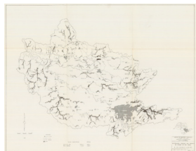
Figura 2: Carta número 6 da DEV (IVANCKO et al. , 1985).