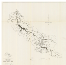
Figura 1: Carta número 3 da DEV (IVANCKO et al. , 1985).

O material central utilizado na execução deste projeto consistiu nas cartas número 3 e 6 do trabalho Distribuição Espacial das Várzeas (DEV) no Estado de São Paulo, de IVANCKO et al. , 1985 (Figuras 1 e 2), que compreendem a área de interesse deste projeto. Uma vez digitalizadas, as cartas foram georreferenciadas e vetorizadas utilizando um Sistema de Informações Geográficas (SIG). Após esse processo, realizou-se o cruzamento das áreas de várzea com o mapa de uso e ocupação das terras das UGRHI 5 e 9, permitindo a identificação e o mapeamento do uso e ocupação nas planícies de inundação das regiões de interesse (Figura 3).