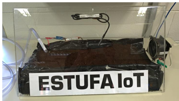
Figura 3. Estufa Automatizada IoT.