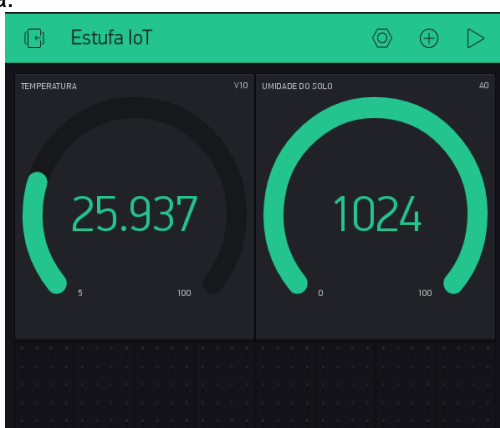
Figura 1. Monitoramento da temperatura e da umidade do solo através do aplicativo Blynk.

No momento da escrita deste resumo, a hortaliça estava na fase de germinação, não sendo possível sua visualização, pois ela leva em torno de 60 dias para a colheita.