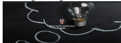
Figura 2. Blog