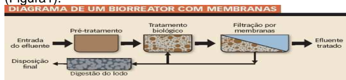
Figura 1 – Esquema do sistema MBR- EPAR-SANASA.

O presente trabalho foi realizado em um sistema de tratamento de esgoto doméstico, aplicando um MBR (Figura1).