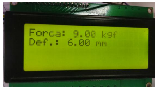
Figura 2. Exemplo da aplicação do display.

As informações relacionadas à força registrada pela célula de carga e a deformação registrada pelos pulsos do motor de passo, durante o ensaio, são enviadas à placa de circuito, que envia esses dados ao display, como no exemplo da figura 2.