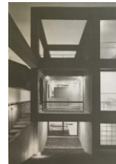
Figura 5. Fachada. (FURUYAMA, 1995, p. 47.)

Nesse projeto, Ando adota grandes aberturas para o exterior, tornando a iluminação do interior mais abundante. O gradiente de privacidade é dado pela disposição dos pavimentos. As áreas privadas se situam no térreo, velado por um muro, e no segundo pavimento, enquanto a entrada se dá por meio de uma escada ao primeiro pavimento. Além disso, as divisões internas entre os cômodos são finas, se equivalendo às partições móveis presentes na arquitetura tradicional japonesa.