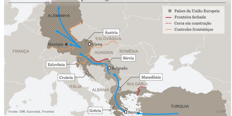
A rota dos Balcãs usada por refugiados.