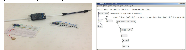
Figura 2: Therengala e Audio Game Figura 3: Patch do Pd

alcançados com: 1) a criação de um audio game , um jogo de adivinhações, constituído por um protótipo com botões interruptores que, quando acionados, emitem melodias; 2) uso e aprimoramento da therengala , uma bengala multissensorial para a produção de paisagem sonora controlada pelo gesto do usuário (PORTAS, 2016); 3) uso de sensores, que trabalhando em conjunto com o Pd servem para a composição de paisagem sonora ( soundscape ); 4) desenvolvimento de uma tabela comparativa do nível de acessibilidade apresentado por vários softwares de notação musical em processos de criação e edição de partituras.