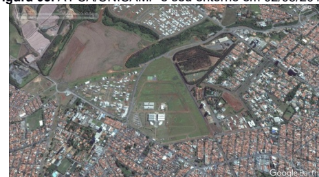
Figura 03. A FCA/UNICAMP e seu entorno em 02/05/2016.

Na figura 02, ainda não havia nada construído no terreno do campus (área destacada em vermelho) que hoje abriga a FCA/UNICAMP.