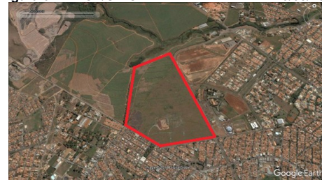
Figura 02. A FCA/UNICAMP e seu entorno em 10/05/2005.

A seguir serão apresentadas e analisadas parte destas mudanças por meio de dois mapas da região em diferentes períodos, antes da construção da FCA e atualmente.