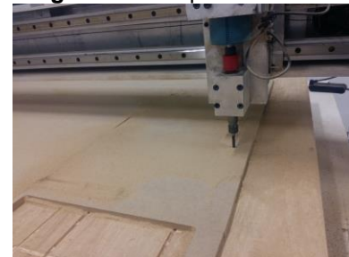
Figura 2 – Máquina Router

Fusion. Após o corte, a montagem da máquina foi iniciada. Posteriormente, fizemos uso da máquina de confecção de circuitos impressos.