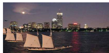
Figura 2: Corrida de Barcos.

No ambiente de programação Scratch, a Corrida de Barcos, Figura 2, foi criada com o intuito de se familiarizar com a programação nesta linguagem.