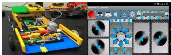
Figura 2: Caminhão e aplicativo Arduino Bluetooth RC Car

Com a realização desses trabalhos, noções sobre programação e montagem de circuitos elétricos foram adquiridas. Um dos projetos mais importantes para esse aprendizado foi o Caminhão, Figura 1, no qual utilizamos peças LEGO, sensor de toque, controlador Arduino, comunicação Bluetooth e o aplicativo Arduino Bluetooth RC Car. Este aplicativo, que possui quatro botões básicos, FRENTE, TRÁS, DIREITA e ESQUERDA, serviu para estabelecer a comunicação Bluetooth entre o celular e o Arduino. Neste sentido, foi construído um automóvel que se deslocava obedecendo a comandos vindos do celular e que tinha na parte dianteira um sensor que ao bater em um obstáculo parava o Caminhão.