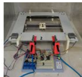
Figura 2. À esquerda uma ilustração e à direita uma foto do aparato mecânico. 1) Local de afiação da amostra. 2) Sprays ejetores de solução. 3) Eletrônica controladora do processo.