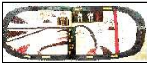
Figura 1. Cartografia medieval

Mapa T-O.