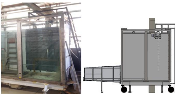
Figura 1. Tanque de teste utilizado para os experimentos

Para o estudo do comportamento dinâmico do riser vertical foi projetado e fabricado um modelo em escala reduzida, e medidos forças, movimentos e cargas dinâmicas do experimento.