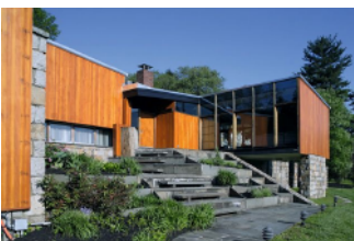
Figura 1. Foto da Genel House

(Disponível em < https://br.pinterest.com/pin/131871095313614483/?from_navigate=true > acesso em jul. 2016)