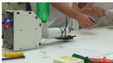
Figura 1. Extrusora de fios em funcionamento

Como resultado do trabalho desenvolvido pelo grupo, montamos primeiramente uma extrusora de fios para ser utilizado na impressora 3D. Esta extrusora (Fig.1) aquece e derrete pellets de material plástico, e pressiona este material derretido por um orifício modelando o fio. O kit da extrusora também foi adquirido comercialmente.