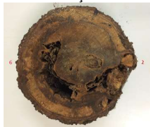
Figura 1: Fotografia do disco de Copaifera sp (Copaiba)

Do resultado dos ensaios foram geradas imagens tomográficas bem como gráficos de resistência à perfuração, os quais foram analisados de forma isolada e conjunta. Neste resumo apresenta-se o estudo de caso com o disco da espécie Copaifera sp (Copaiba) – Figura 1, que apresentava deterioração severa.