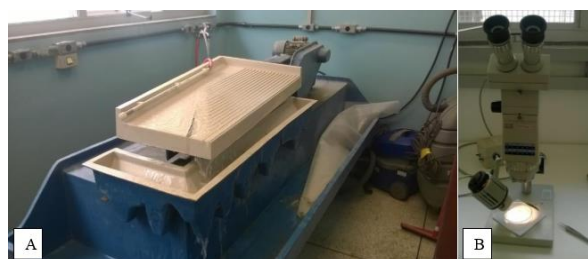
Figura 1. Equipamentos utilizados na separação de badeleíta. A) Mesa vibratória Winfley e B) Lupa binocular Zeiss com aumento de até 63 vezes.

Os grãos de badeleíta foram encontrados na amostra do Carbonatito de Jacupiranga e não nas amostras inicialmente estudadas, estes grãos minerais foram confirmados no MEV e puderam passar para a etapa de datação. Este procedimento tem grande relevância porque atesta a eficiência do método no Laboratório de Separação Mineral do IG/UNICAMP.