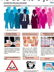
Figura 1. Site: http://jornalunisaude.wix.com/saude-do-trabalhador

Abaixo imagens do site e jornais publicados: