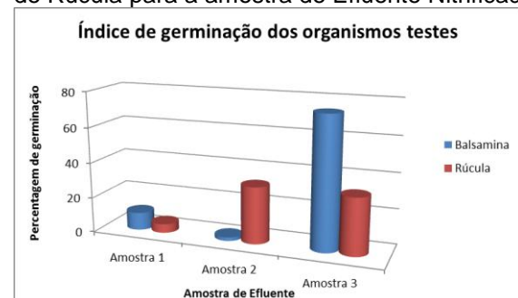
Figura 2. Índice de germinação dos organismos