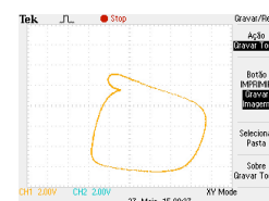
Figura 2. Ciclo limite gerado pelo circuito.